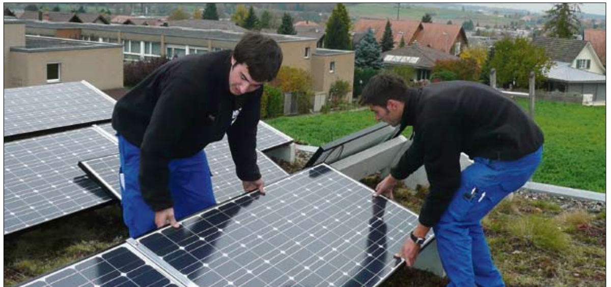
Mitarbeiter des Solarcenter Muntwyler montieren die Solaranlage bei Gutknechts.