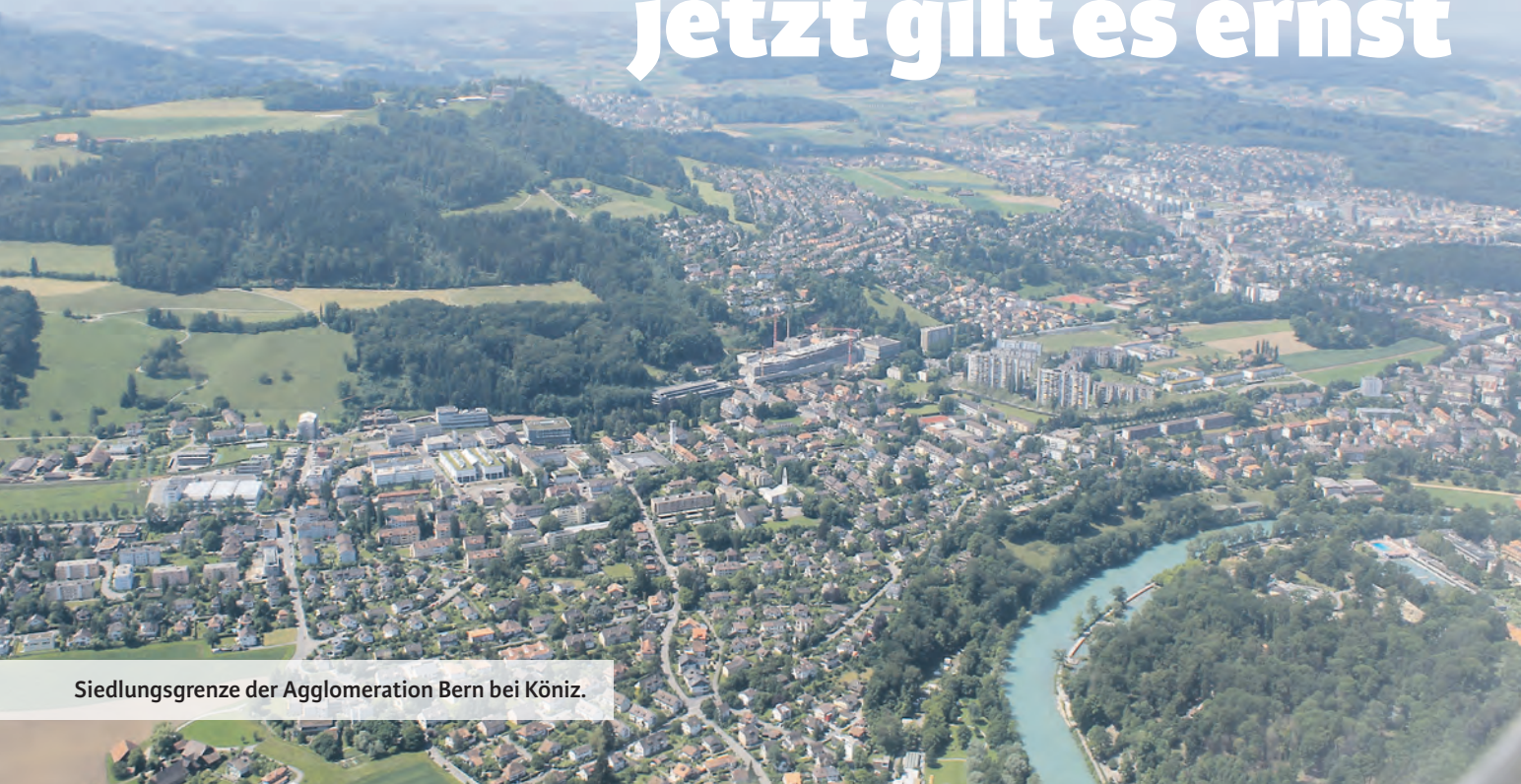
Siedlungsgrenze der Agglomeration Bern bei Köniz.

BEI DER JETZT IM GROSSEN RAT ZUR DEBATTE STEHENDEN REVISION DES BAUGESETZES GEHT ES UM EIN WICHTIGES ZIEL AUS DER WAHLPLATTFORM 2014 DER SP. DIE STOSSRICHTUNG, WIE SIE VOM NATIONALEN SOUVERÄN IM MÄRZ 2013 MIT EINEM KLAREN JA ZUM REVIDIERTEN RAUMPLANUNGSGESETZ VORGEZEIGT WURDE, IST AUF KANTONS GEBIET WEITERZUFOLGEN. STATT UNVERSEHRTE LANDSCHAFTEN ZU ÜBERBAUEN, SOLLEN SIEDLUNGEN MIT BESTEHENDEN BAUZONEN WEITERENTWICKELT WERDEN.