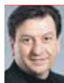
Corrado Pardini, Nationalrat SP und Co-Präsident Komitee «Faire Steuern – Für Familien»